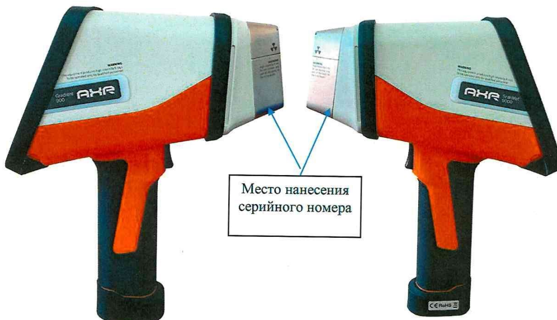
Рисунок 1 – Общий вид анализаторов и место нанесения серийного номера

Общий вид анализаторов и место нанесения серийного номера представлены на рисунке 1.